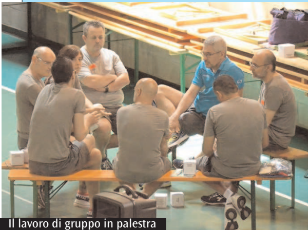
Il lavoro di gruppo in palestra

provocatorio, l'adulto demotivato. Ogni corsista ha deciso a quale modulo formativo partecipare, secondo i propri interessi e i ruoli che riveste in società, in oratorio, a scuola. Probabilmente questa è stata la forma vincente, insieme alla vicinanza della location, che ha favorito una partecipazione così massiccia. Interessanti le lezioni svolte in aula e in palestra da docenti preparati e a loro volta coinvolti dall'entusiasmo dei corsisti.