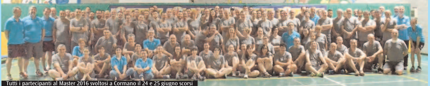
Tutti i partecipanti al Master 2016 svoltosi a Cormano il 24 e 25 giugno scorsi

Un grande risultato che testimonia la formula vincente della proposta