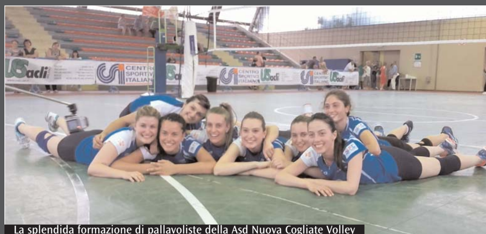
La splendida formazione di pallavoliste della Asd Nuova Cogliate Volley

Una stagione fantastica, quella appena terminata, con il terzo successo di fila per la squadra open femminile della Asd NUOVA COGLIATE VOLLEY, iniziata a settembre 2015. L'aspettativa di arrivare almeno tra le prime quattro squadre per conquistare l'open eccellenza è diventata una scalata di successi uno dietro l'altro: 1° in Campionato open A1 e diritto al passaggio in Eccellenza con 22 partite giocate e 22 vittorie con solo 5 set persi; 1° in Coppa open con 5 partite giocate e 5 vittorie e 2 soli set persi ed infine 1° nel Torneo Prestige disputando 8 partite e raccogliendo 8 vittorie con solo 2 set persi. Tutto ciò è merito di un gruppo stupendo di ragazze con una grande passione per la pallavolo, una squadra dove tutte hanno sempre messo impegno, voglia, grinta, determinazione e consapevolezza della loro crescita sportiva, con tanti sacrifici e rinunce. Orgoglioso di essere il loro presidente saluto le mie CAMPIONESSE!