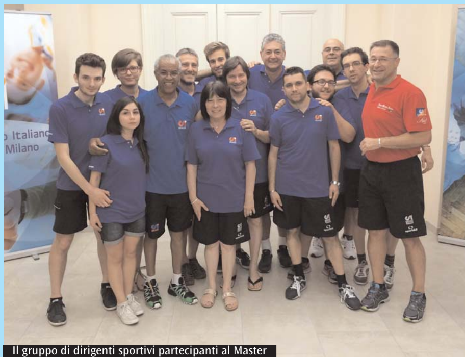
Il gruppo di dirigenti sportivi partecipanti al Master