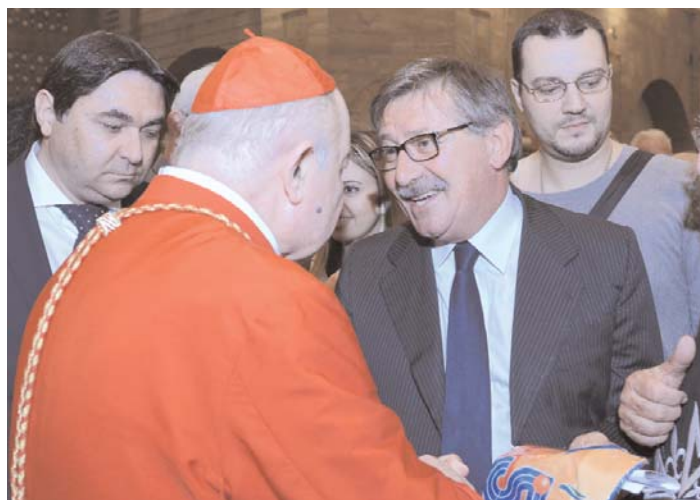
Il cardinale Tettamanzi, al termine della processione del Corpus Domini del 19 giugno scorso, ha recitato una preghiera

dal titolo "Rinnova in noi la Tua gioia, Signore". E' una preghiera molto bella e vera, che vi invito a leggere sul sito della nostra