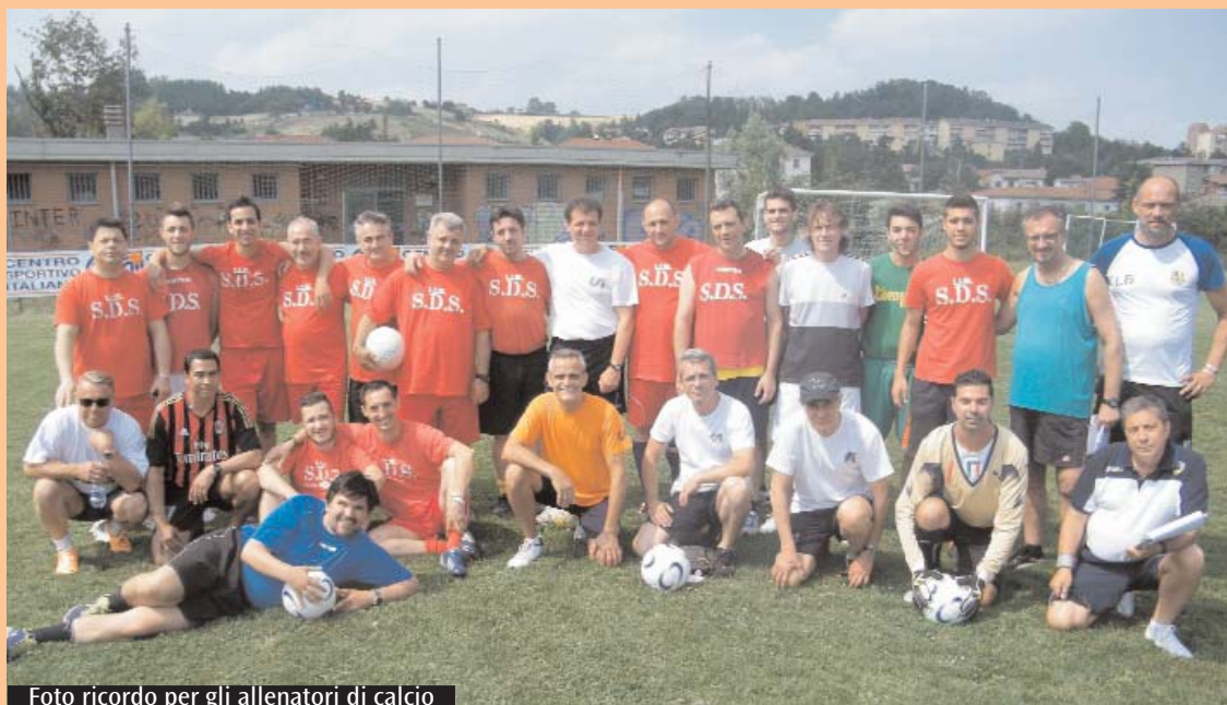
Foto ricordo per gli allenatori di calcio

ottimi risultati anche se con grandi sacrifici... che tempra! Un'autentica lezione di vita. Posso affermare che, l'edizione di quest'anno è stata, senza dubbio, il miglior appuntamento formativo residenziale al quale abbiamo partecipato.