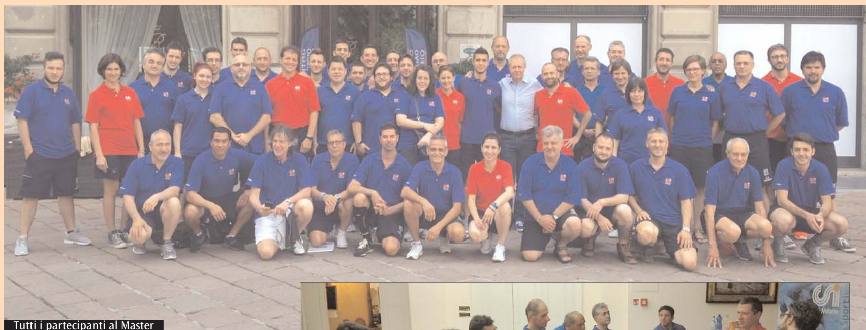
Tutti i partecipanti al Master

Ben 44 i partecipanti tra dirigenti sportivi e allenatori di calcio e pallavolo