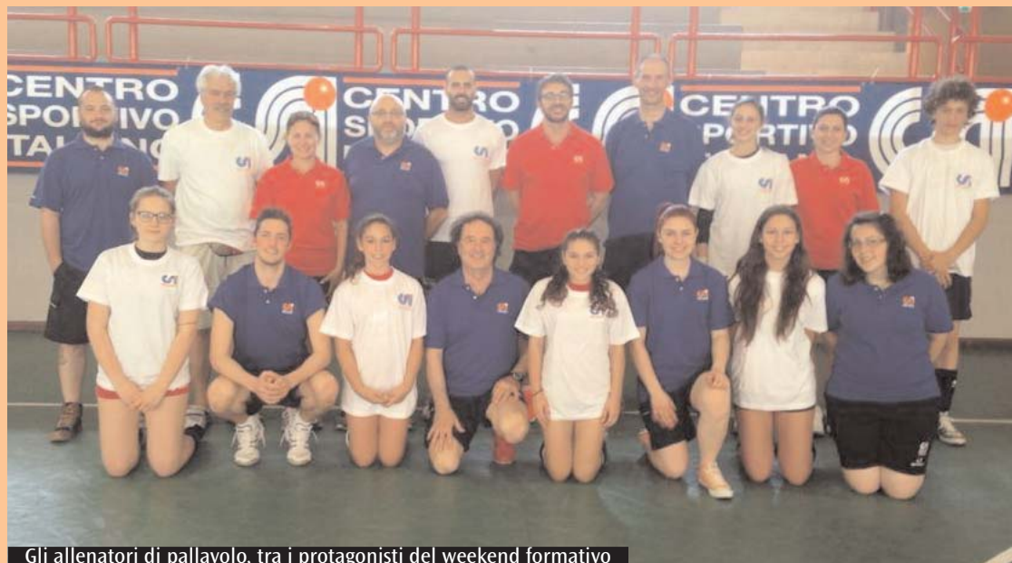
Gli allenatori di pallavolo, tra i protagonisti del weekend formativo