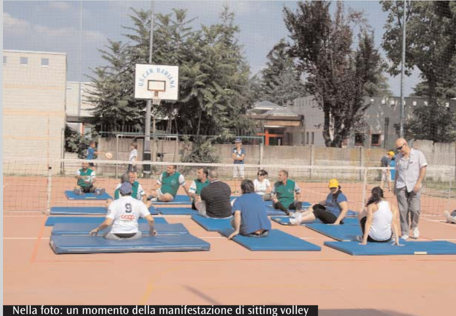
Nella foto: un momento della manifestazione di sitting volley

Bariana di Garbagnate apre a una disciplina ancora poco conosciuta