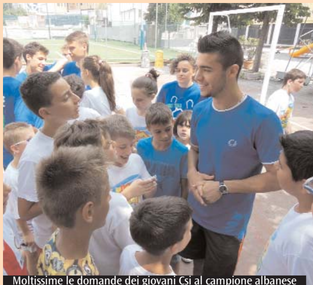
Moltissime le domande dei giovani Csi al campione albanese