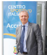
di Massimo Achini