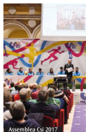
Assemblea Csi 2017