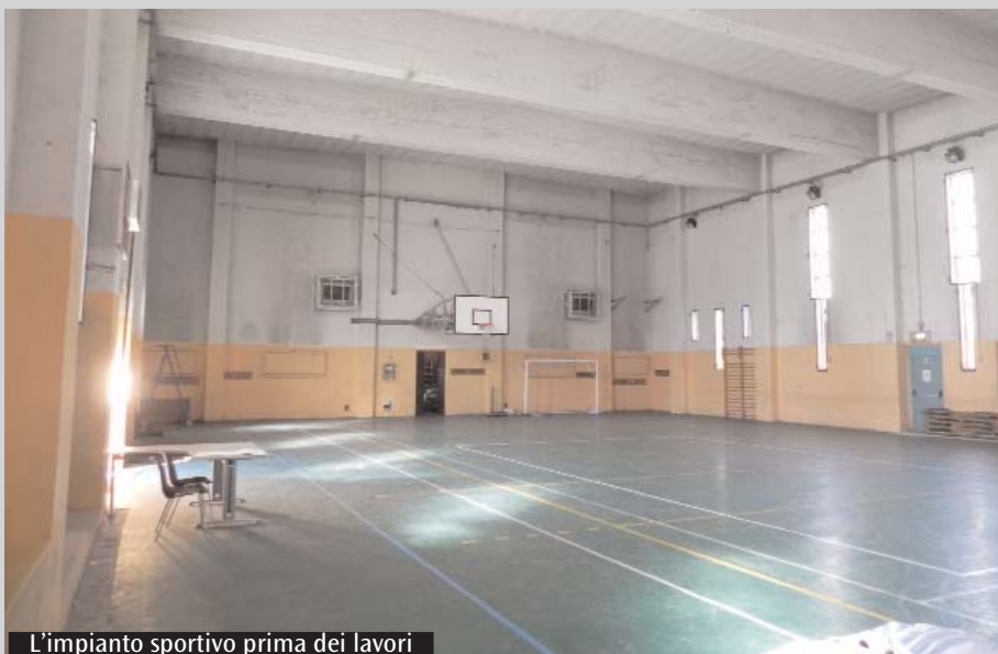
L'impianto sportivo prima dei lavori

La ristrutturazione della palestra è stata ultimata, i ragazzi e le ragazze possono utilizzarla senza problemi e, inol-