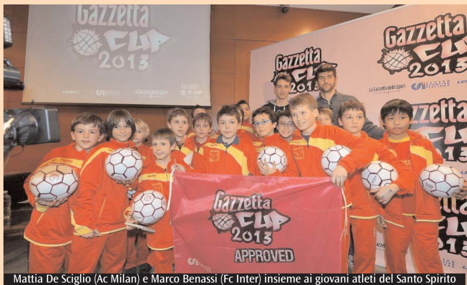
Mattia De Sciglio (Ac Milan) e Marco Benassi (Fc Inter) insieme ai giovani atleti del Santo Spirito

Non ultimo, va ricordato che è prossimo l'inizio della tappa milanese di questo affascinante torneo: a fine mese sarà dato il fischio d'inizio alle "fasi interne". La "fase cittadina", invece, si svolgerà il 26 maggio al Centro Vismara e vedrà in gara le 16 migliori squadre delle categorie Junior e Young (32 formazioni in tutto). Poi, grande attesa, è riservata alla "fase nazionale": l'appuntamento è per l'11 giugno sul campo di San Siro.