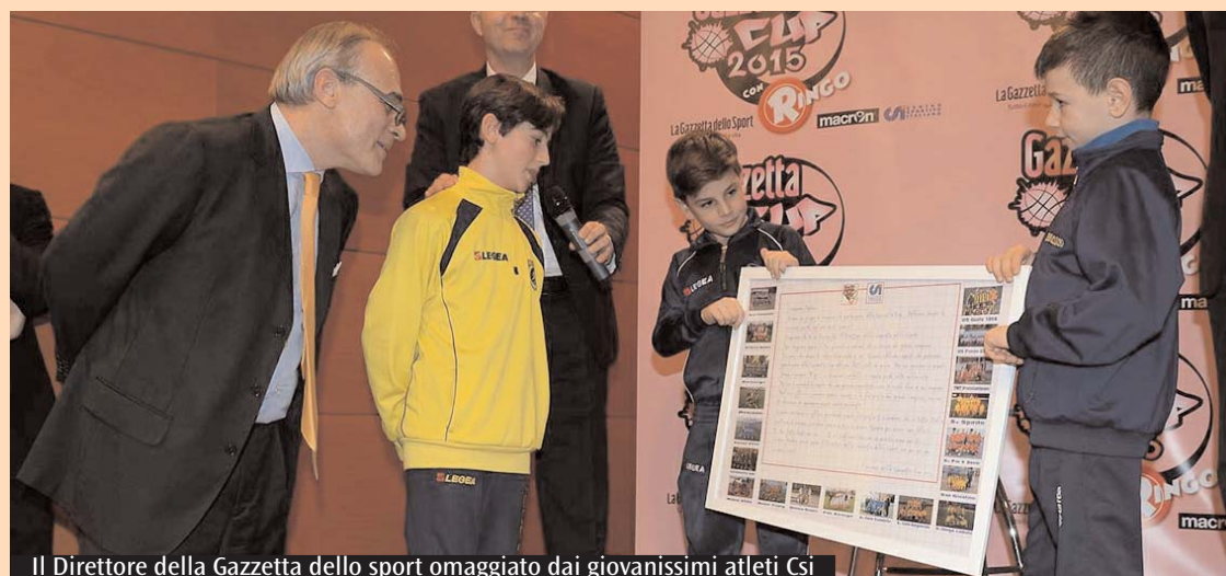
Il Direttore della Gazzetta dello sport omaggiato dai giovanissimi atleti Csi

Il contest si svolgerà in occasione di tutte le Fasi Cittadine e della Finale Nazionale. In ognuna di esse verranno assegnati due premi per ciascuna categoria (Junior e Young): un completo da calcio Ringo e un pallone autografato da Stephan El Shaarawy andranno ai vincitori del contest; saranno inoltre messi in palio ed estratti a sorte, tra tutti i partecipanti, altri due palloni (uno per categoria) autografati da El Shaarawy.