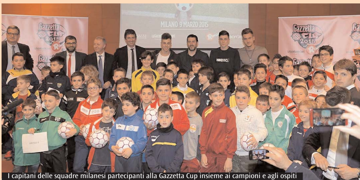
I capitani delle squadre milanesi partecipanti alla Gazzetta Cup insieme ai campioni e agli ospiti