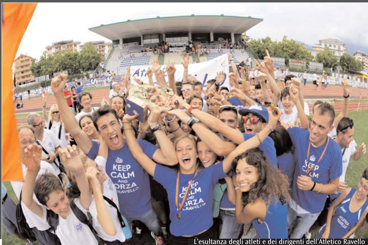
L'esultanza degli atleti e dei dirigenti dell'Atletico Ravello