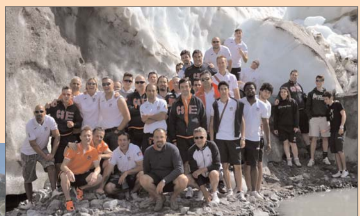
In alto: gli arbitri di calcio in posa alle pendici del ghiacciaio del Morterasc