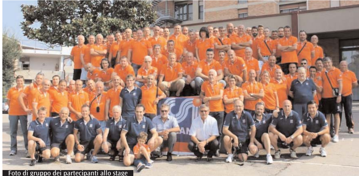
Foto di gruppo dei partecipanti allo stage

Dopo una breve pausa e la tradizionale foto di gruppo, tutti gli arbitri sono stati sottoposti ai quiz tecnici individuali per saggiare la preparazione di ciascuno. Nel pomeriggio, invece, si sono seduti ancora dietro i banchi e dopo il saluto del Sindaco