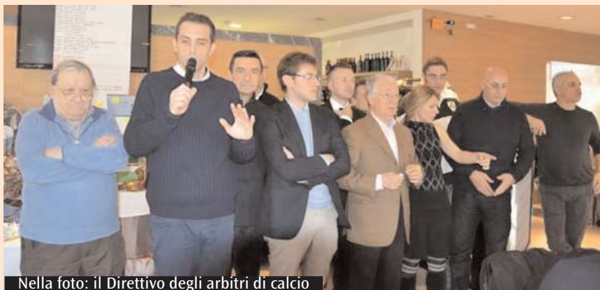
Nella foto: il Direttivo degli arbitri di calcio